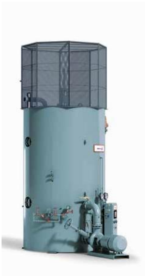
电极式锅炉结构简图